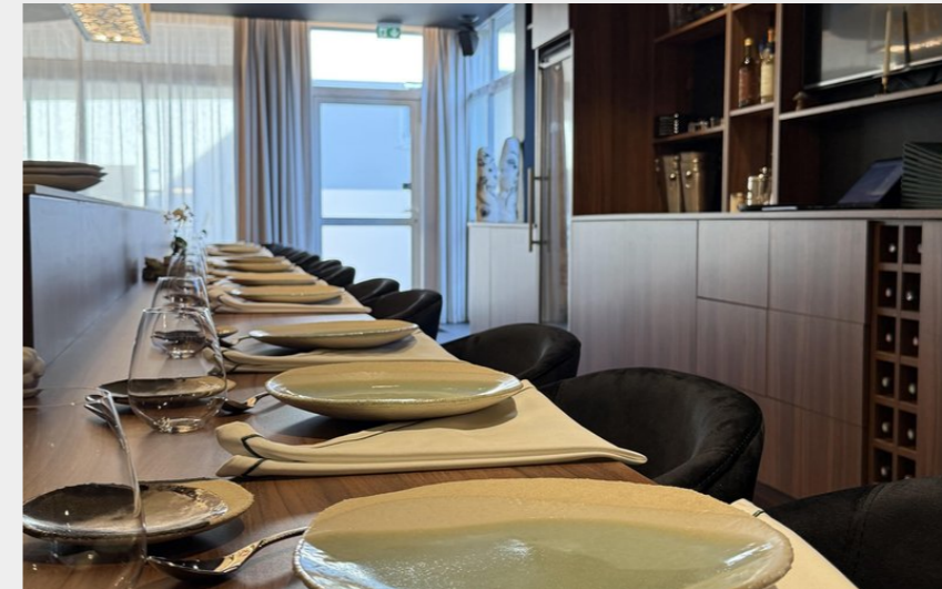
Table unique face à la cuisine ouverte - VERVINIA