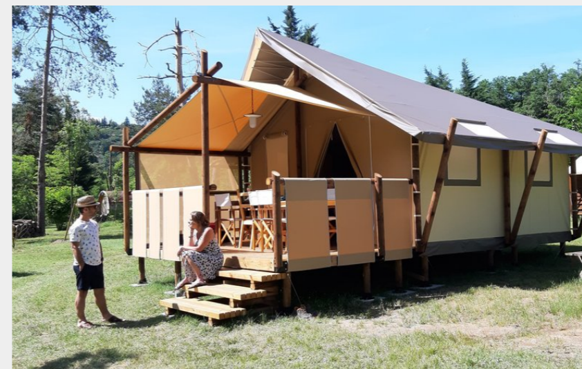
Crédit photo : Jungle Lodge, 5/7 personnes, Camping Le Viaduc (Camping Le Viaduc Ardeche)