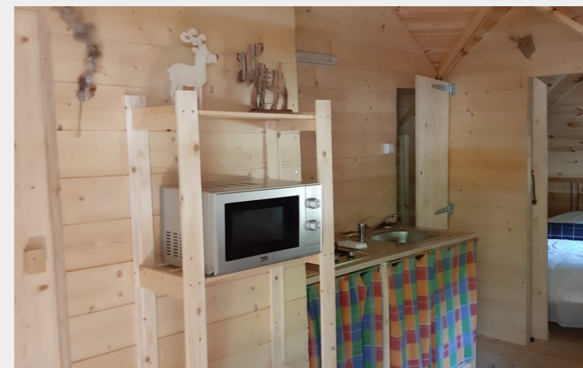
Crédit photo : Kota 4p - cuisine, coin repas (Camping Le Viaduc Ardeche)