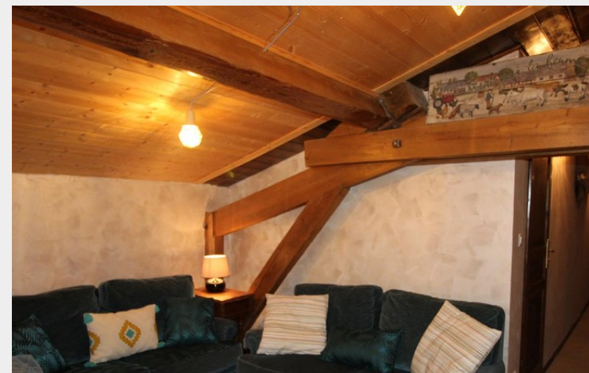
A l'étage : coin salon avec canapés et fauteuil.