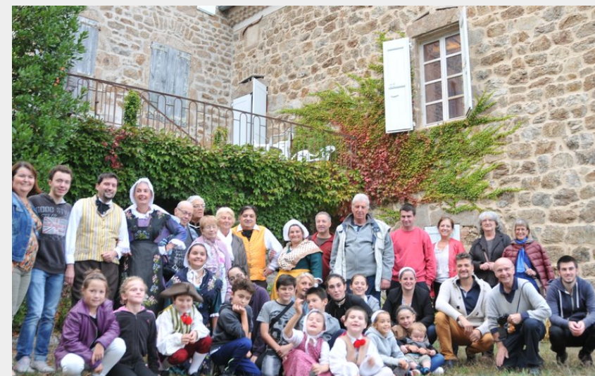
Crédit photo : Visite de groupe Maison Charles Forot (Yves Pézilla)