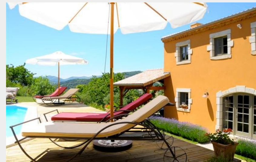
Crédit photo : Piscine de la Bastide de Fontaille (La Bastide de Fontaille)