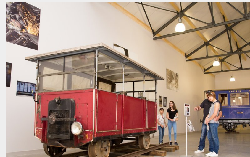
Crédit photo : espace de découverte du chemin de fer_Train de l'Ardèche (S. Bridot)