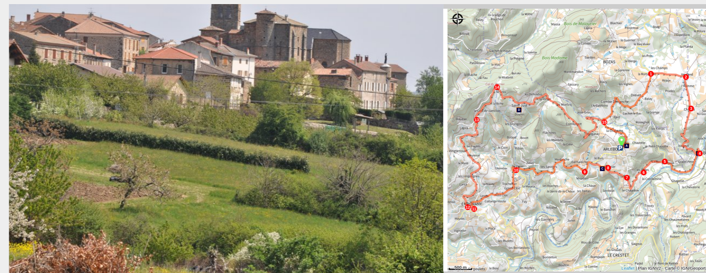
Vue du village

Autour d'Arlebosc, du bord du Doux au col du Perrier.