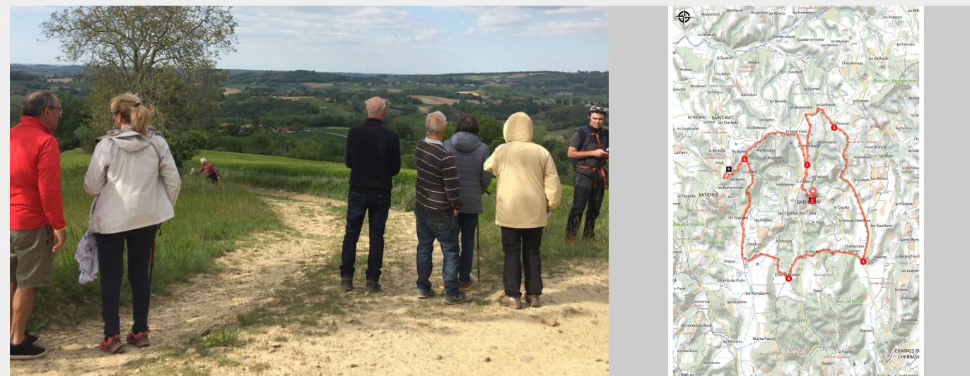
Point de vue sur la balade (arche-agglo-admin)

C'est la fête des collines, d'un faîte à l'autre, on domine cette région par des panoramiques à 360°. Chemins de crêtes, combes, vastes horizons, sous bois, campagne, tout y est.