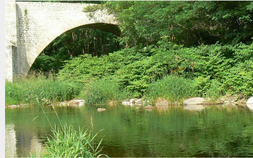
Pont du Roi