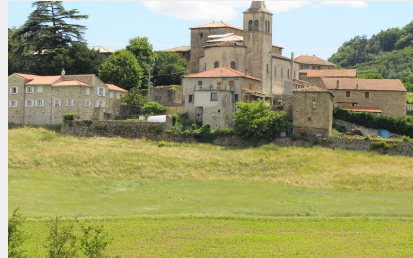
Vue du village