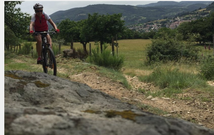
Passage à Montpeyroux (Ardèche Hermitage Tourisme)