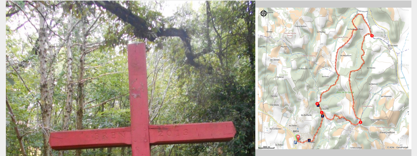
Croix Rouge (Alain Danel)