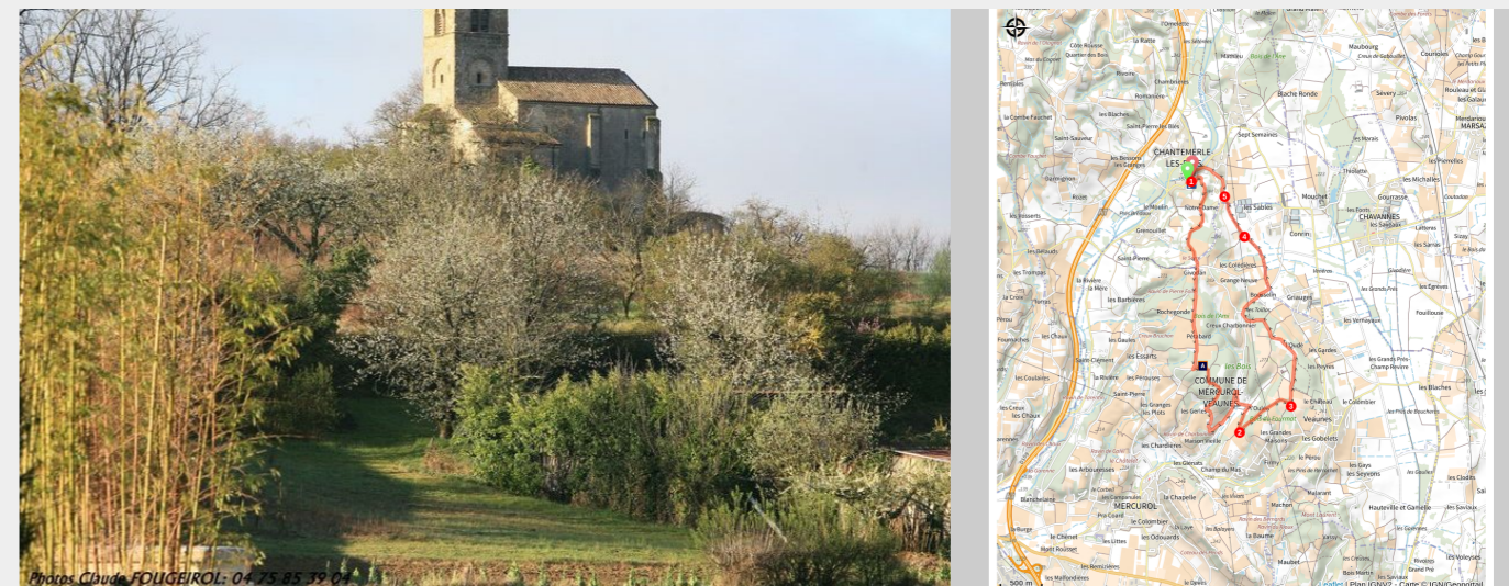
Eglise de Chantemerle les Blés

Randonnée sur les coteaux de molasse autour de Chantemerle les Blés. Profitez d'un bel itinéraire en sous bois et de vues dégagées sur l'ensemble de la campagne environnante.