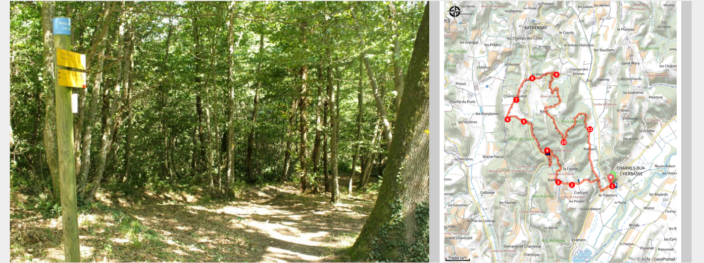
Sentier forestier

Bard, bardage, bardo... treillis de branches ou charge, la forêt à toujours eu une place importante dans nos sociétés. Aujourd'hui, elle possède encore beaucoup de charmes à découvrir durant cette jolie randonnée ombragée.