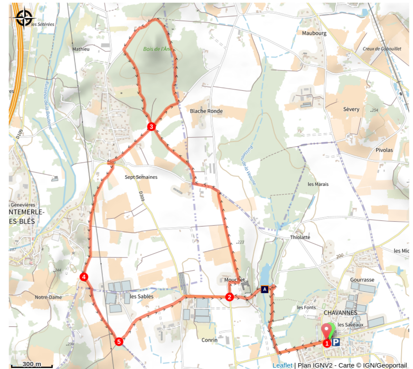
L'étang du Mouchet et ses herbiers aquatiques (A)