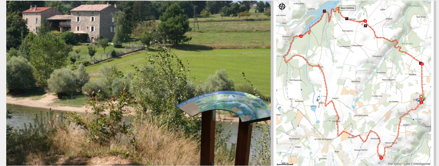
Panneau d'interprétation au bord du lac (Ardèche Hermitage Tourisme)

Une belle promenade à travers la commune de Cheminas avec pour objectif le lac des Meinettes dans son écrin de verdure.