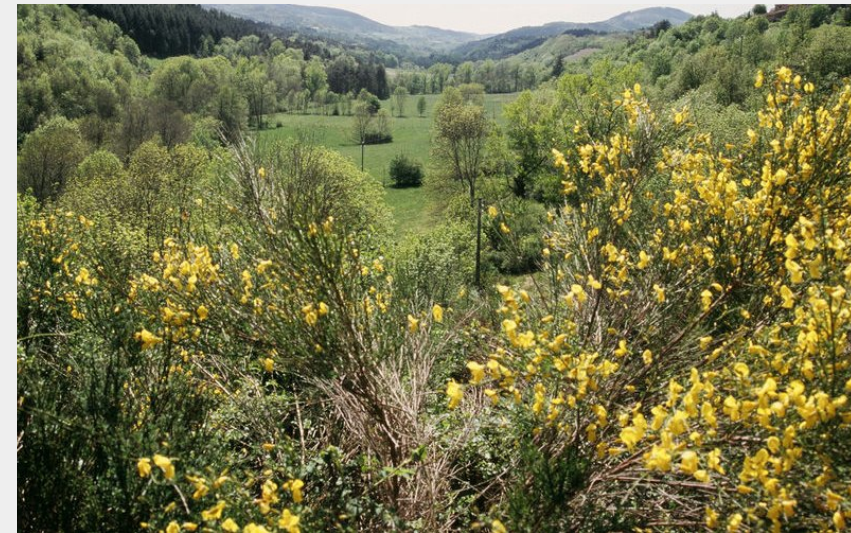
Vallée de l'Ormèze