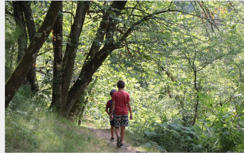
Abords de la Daronne (Ardèche Hermitage Tourisme)