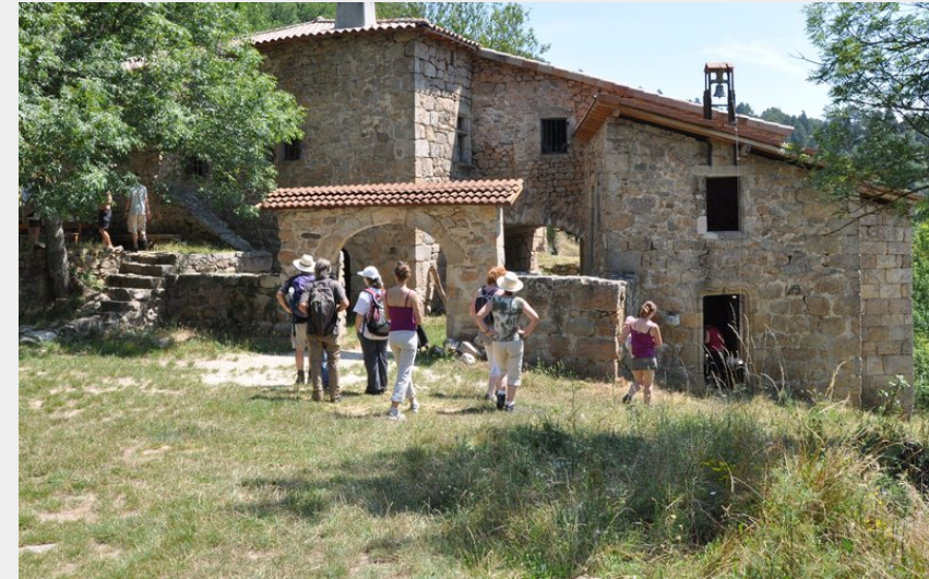
Chapelle de Saint Sorny (Ardèche Hermitage Tourisme)