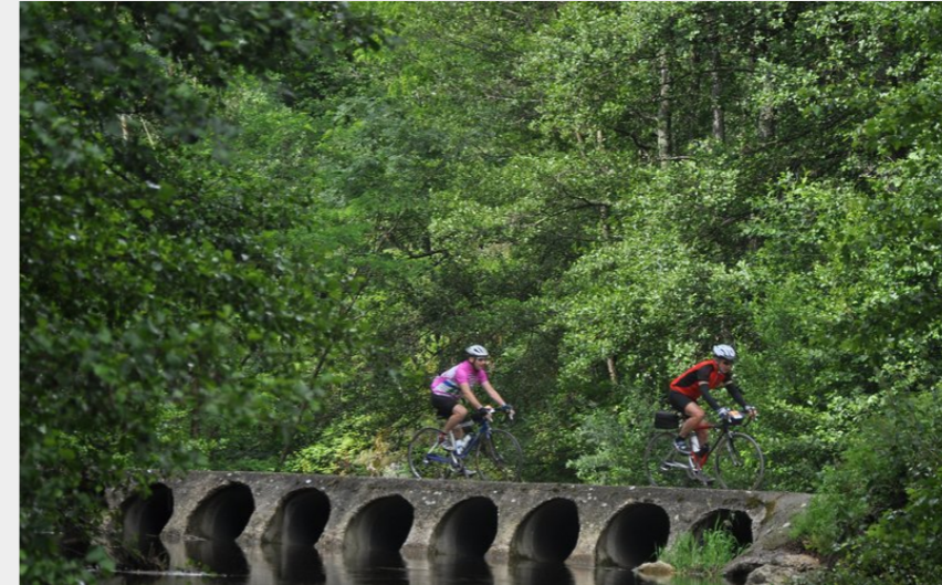
Traversée de la Daronne (Ardèche Hermitage Tourisme)