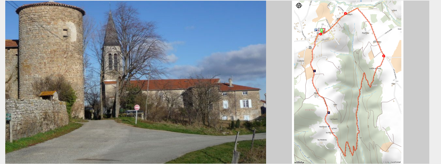
Village d'Étables (Ardèche Hermitage Tourisme)

Ce parcours facile offre un magnifique panorama sur le Vercors et la chaîne des Alpes puis vous emmène traverser le joli et rafraîchissant petit ruisseau "Le Boras".