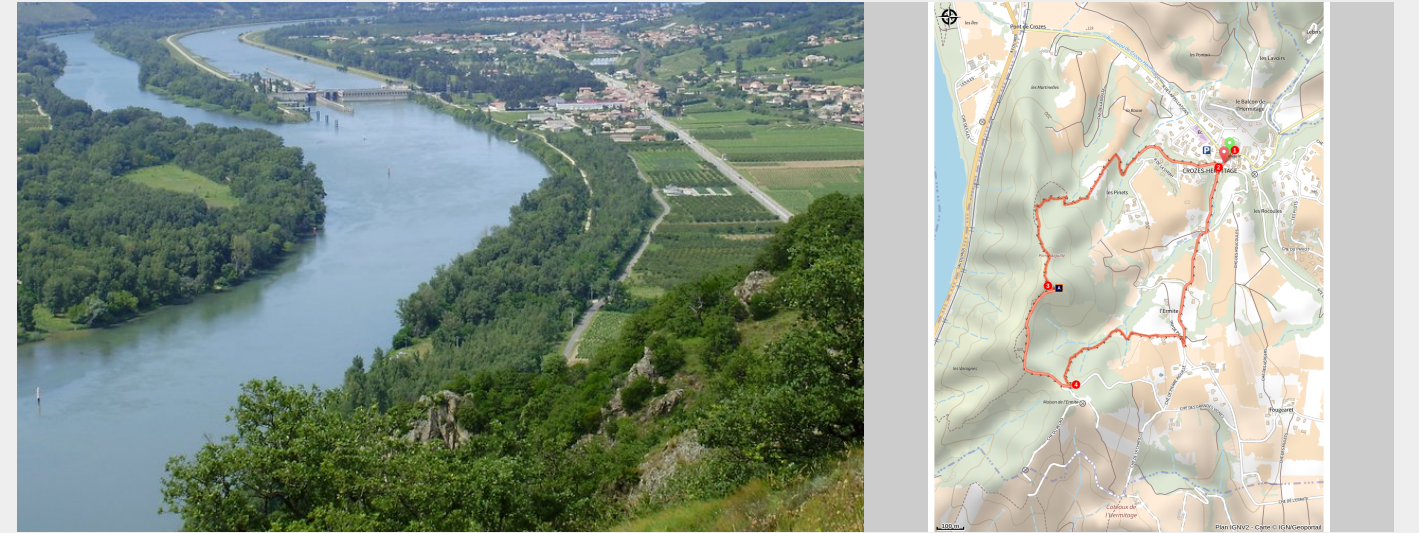
Vue du sommet (Ardèche Hermitage Tourisme)

2 tables d'orientation, splendide panorama.