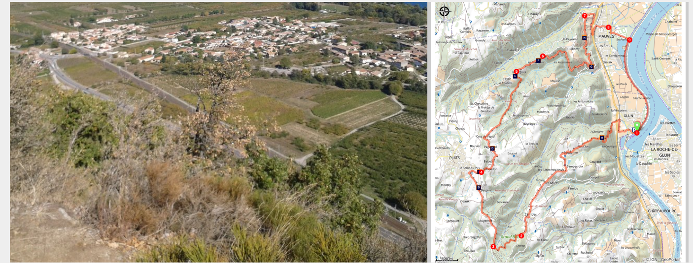
Panorama sur la Vallée du Rhône (Jean Noël Vincent)

La majestueuse Vallée du Rhône sous tous ses angles : des berges du fleuve au plateau panoramique en passant par les coteaux du prestigieux Saint Joseph.