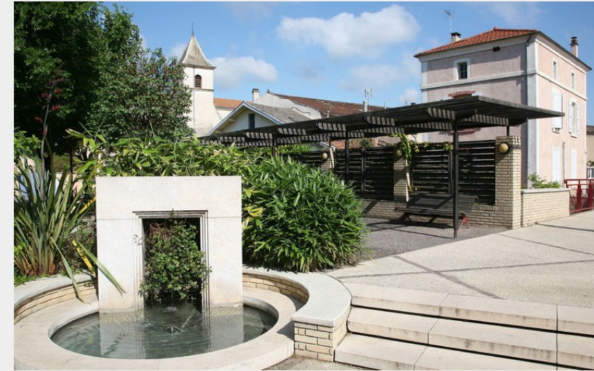
Village de Larnage (Ardèche Hermitage Tourisme)