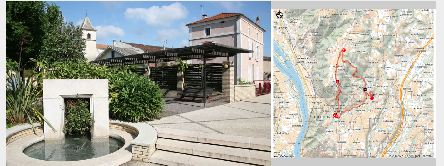
Village de Larnage

Balade tranquille sur les crêtes dominant la Vallée du Rhône, les villages de Larnage et Crozes. Beau point de vue sur le Vercors et la plaine de Valence.