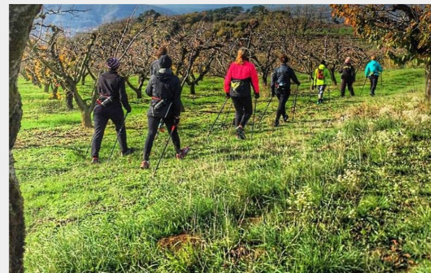
Randonnée hivernale (S Cornette)