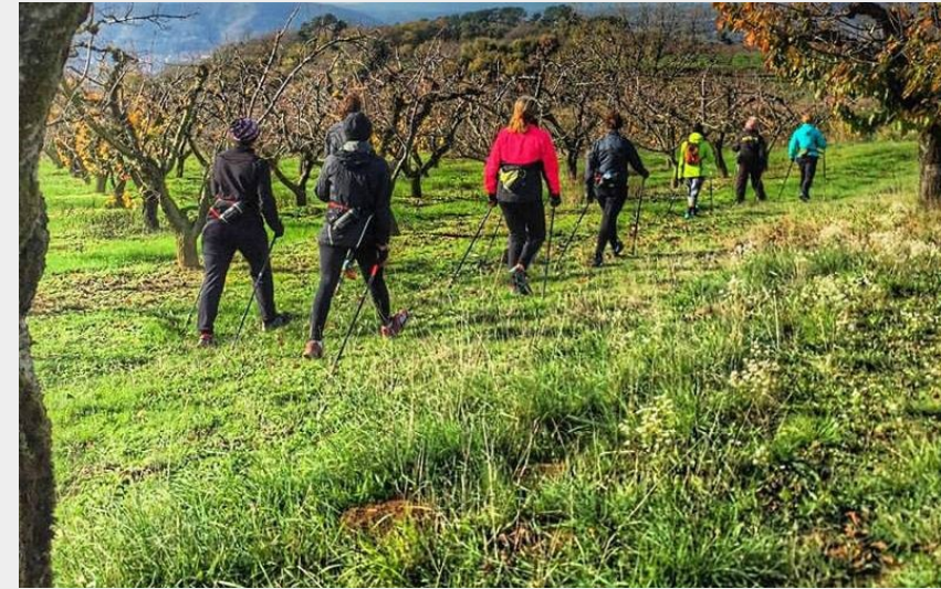
Randonnée hivernale (S Cornette)