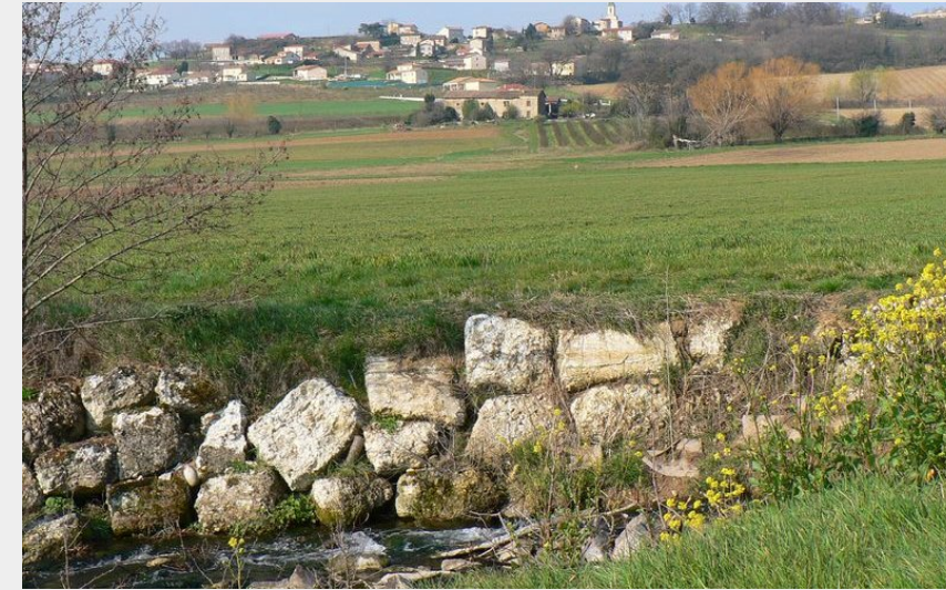
Village de Veunes (Ardèche Hermitage Tourisme)