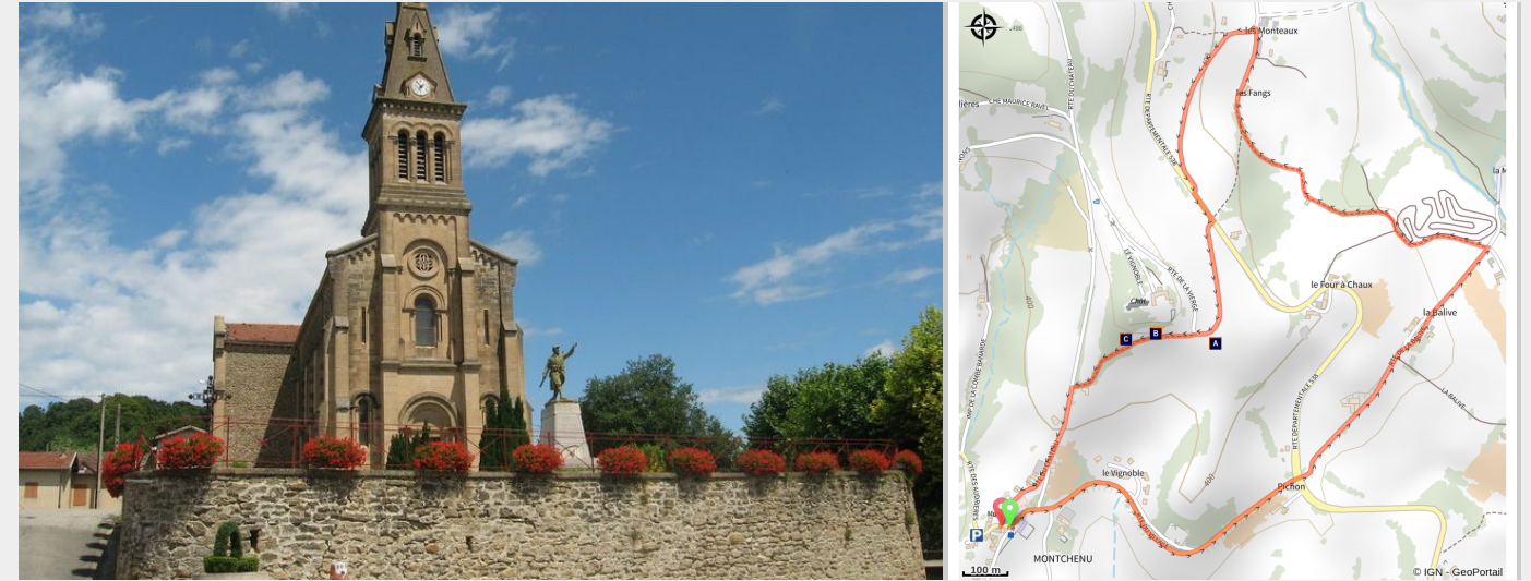
Village de Montchenu (Ardèche Hermitage Tourisme)