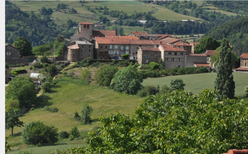
Vue du village de Pailharès