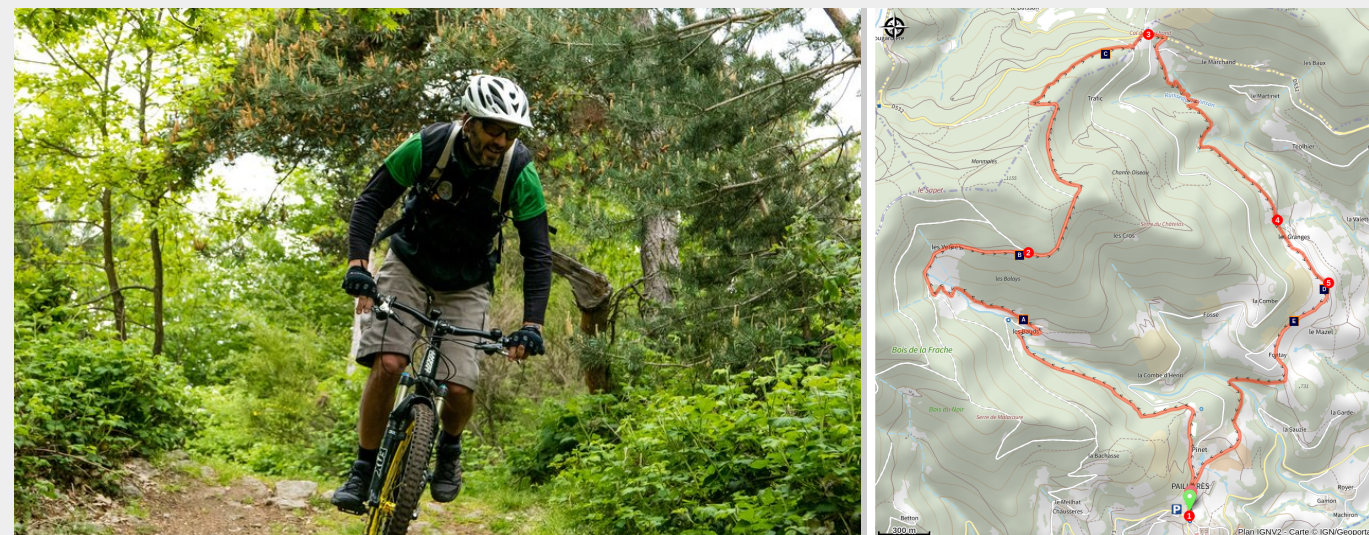
Chemin dans les bois

Circuit court mais exigeant avec une belle montée sur le Sardier bien récompensée par un superbe panorama. De là haut, une descente ludique et technique par endroit offrira le clou du spectacle.