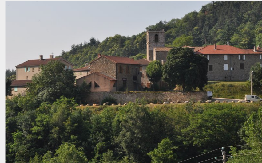
Village de Vaudevant