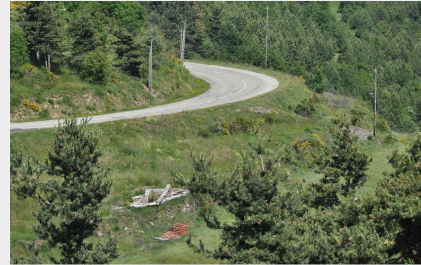
Route en balcon au niveau de Rochebloine