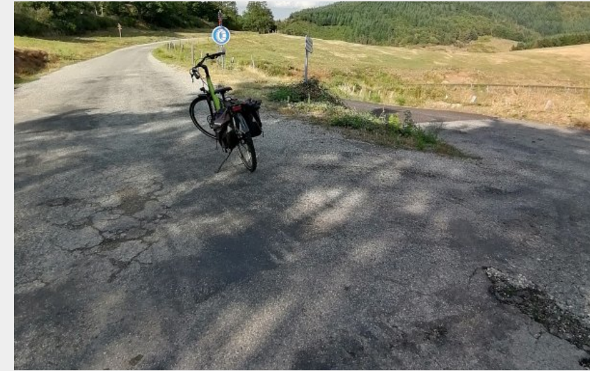
Col de Fontfreyde (Laurence Leroy)