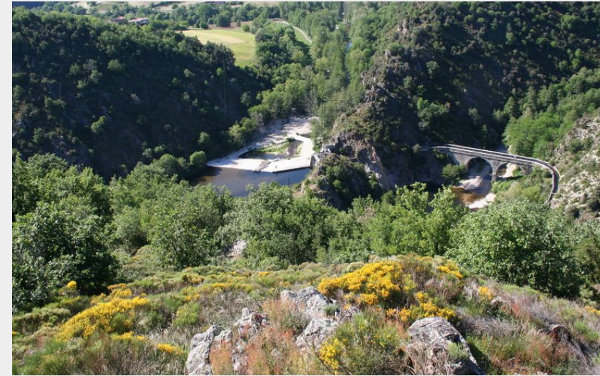
Vue sur le Doux (Ardèche Hermitage Tourisme)