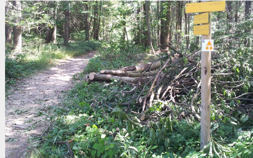
Sentier sur le parcours (Emmanuel Henry)