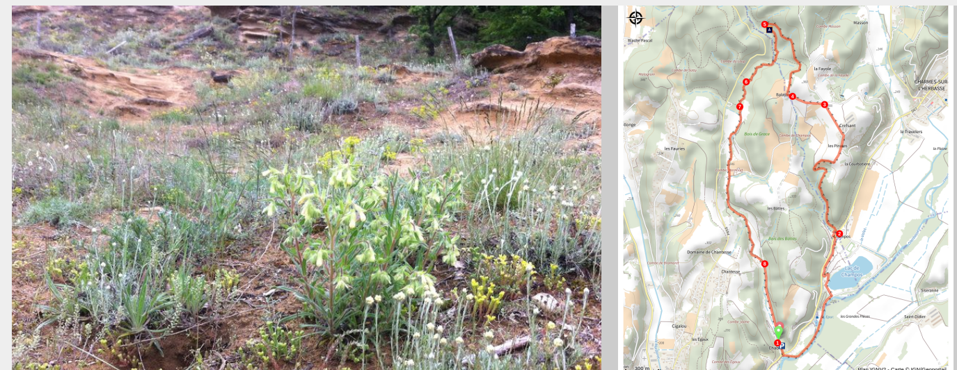
Saffres sur le parcours (Mireille Germain)