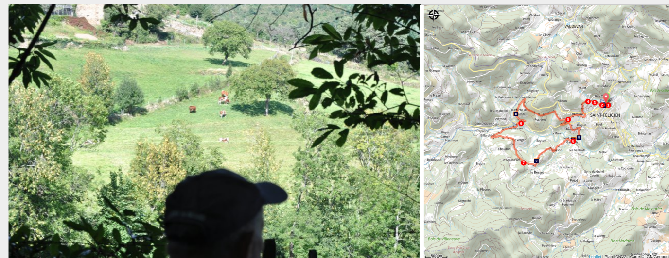
Chemin à proximité du Verger

Cette jolie promenade aux forts dénivelés chemine sur les deux versants de la vallée de la Daronne et vous offre des haltes très agréables sur les bords de cette belle rivière.