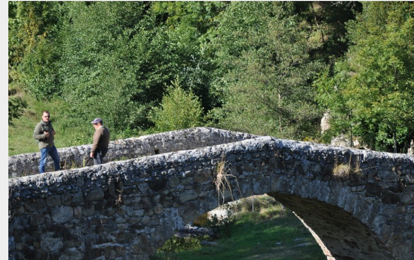
Pont du Moulin des Gaillards