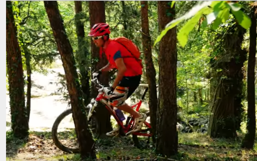
Sentier forestier (Ardèche Hermitage Tourisme)