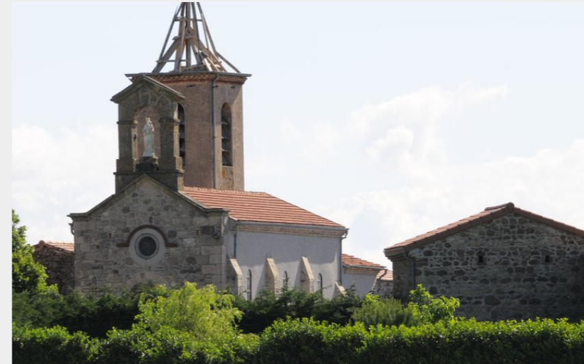
Chapelle Notre Dame de Navas (Ardèche Hermitage Tourisme)