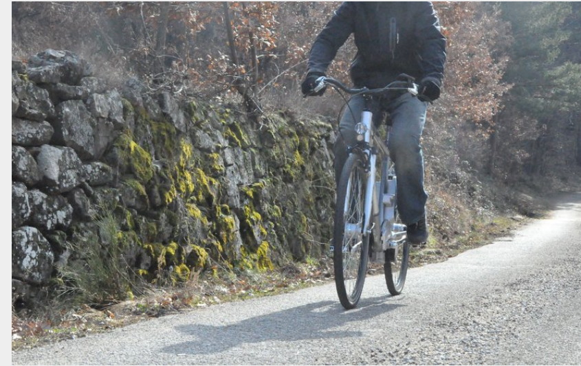
Route bucolique