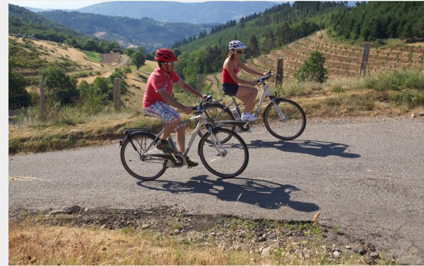
Col de Fontfreyde