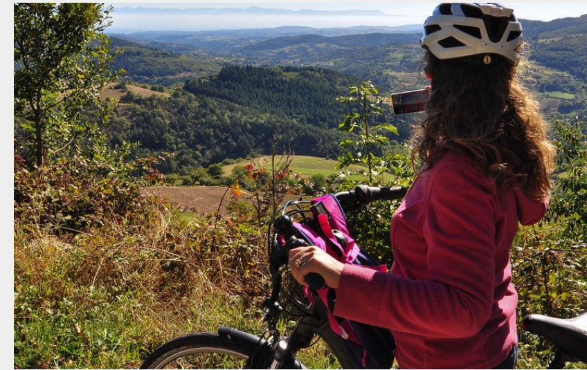
Montée au Col du Marchand (ARG-ADT07)