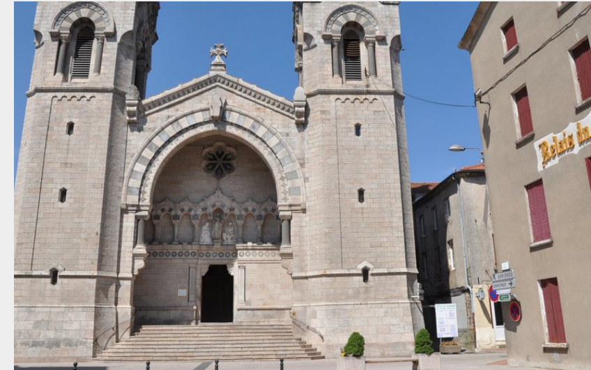
Basilique de Lalouvesc (Ardèche Hermitage Tourisme)