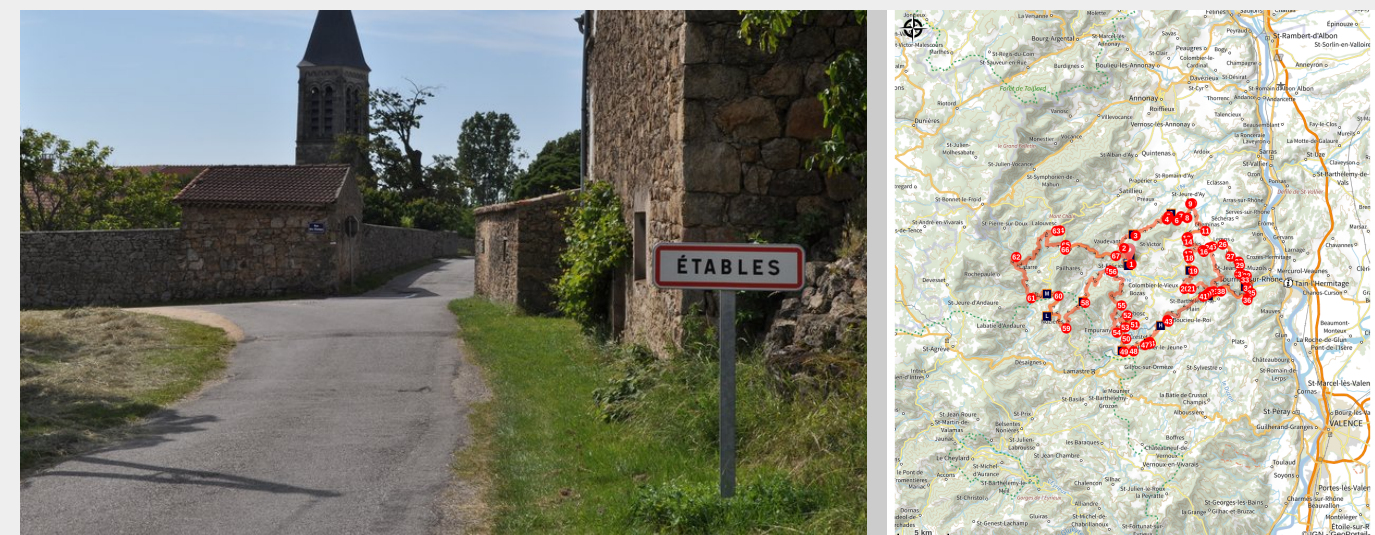
Etables (Ardèche Hermitage Tourisme)

Ce parcours vous fera découvrir les plus belles routes autour de Saint Félicien. Il est conseillé de le faire en 2 jours pour en apprécier la diversité.