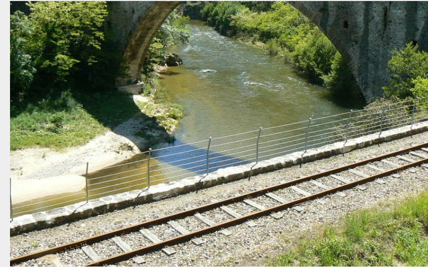
Le Grand Pont sur le Doux