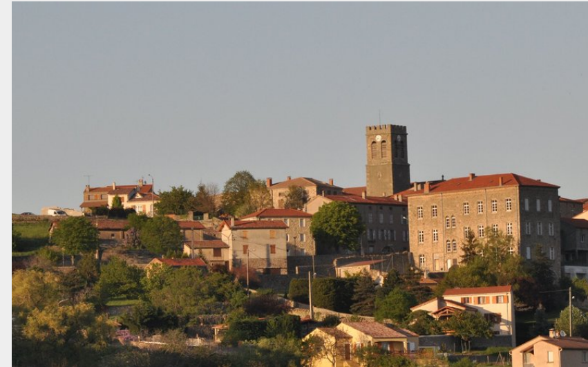
Vue d'ensemble du village