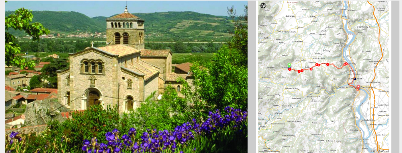
Eglise de Vion

Par de petites routes secrètes, vous évoluerez d'abord sur le plateau avant de plonger sur la Vallée du Rhône avec ses vues panoramiques, entre coupées de passages en forêts. Le final se fera en douceur le long de la ViaRhôna.