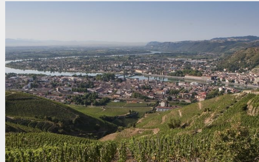
Vignoble de l'Hermitage (Ardèche Hermitage Tourisme)