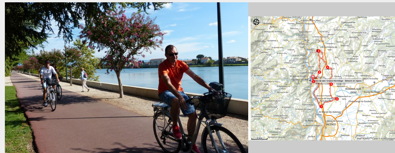
Voie verte le long du Rhône (Ardèche Hermitage Tourisme)

Entre Rhône, Isère, plaines et collines, cet itinéraire sportif, tout en restant accessible, vous permettra de découvrir les paysages de vignes et de vergers qui ont permis de forger l'identité de ce terroir.